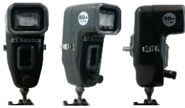
Unterwasserblitze & Blitzgehäuse