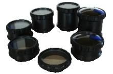
Ports für versch. Objektive